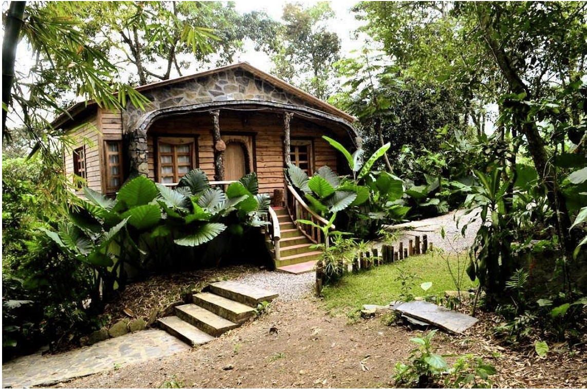
IMAGEN 1. CABAÑA HOTEL TAPASOLI

El hotel cuenta con un restaurante, una cabaña que tiene 2 habitaciones (Imagen 1), además de 8 habitaciones en forma de nidos y una más con temática de madriguera.