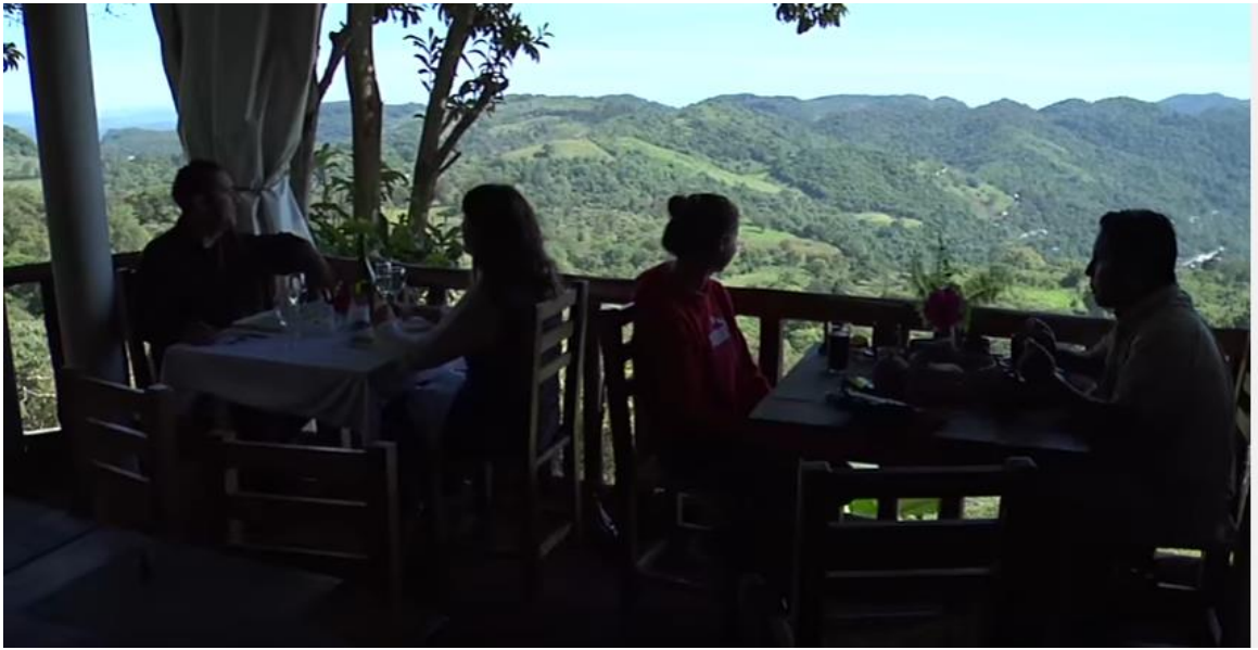
IMAGEN 4. RESTAURANTE HOTEL DEL TAPASOLI