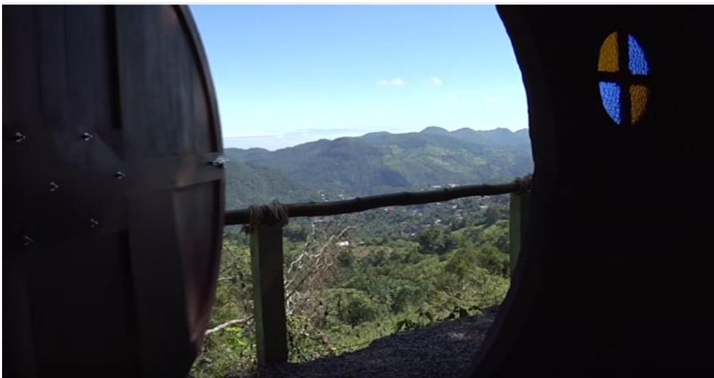
IMAGEN 3. MADRIGUERA HOTEL TAPASOLI

Esta habitación cuenta con una cama y un par de muebles, lo peculiar es que tiene una pequeña ventana redonda y la puerta es redonda y grande de madera, parecida a una puerta de caja fuerte (Imagen 3).