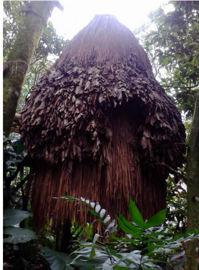
IMAGEN 2. NIDO

Hablando sobre la madriguera, se dice que, la habitación fue inspirada en las madrigueras de las tuzas reales, las cuales son una especie de animal que vive bajo tierra, es decir, la habitación se encuentra prácticamente bajo tierra.