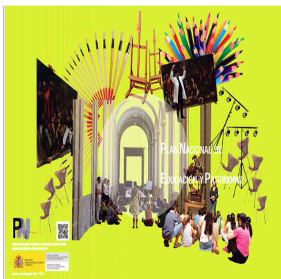
Figura 4. Plan Nacional de Educación y Patrimonio de España [http://ipce.mcu.es/conservacion/planesnacionales/educacion.html]

elemento de identidad cultural, merece a la sensibilidad de los ciudadanos, porque los bienes que lo integran se han convertido en patrimoniales debido exclusivamente a la acción social que cumplen, directamente derivada del aprecio con que los mismos ciudadanos los han ido revalorizando” (LPHE:2) Por tanto, la ley asume que la acción social o el colectivo social legitima el patrimonio cultural en un continuo proceso de revalorización. Esta definición la podemos considerar una declaración de intenciones ya que en el desarrollo de la ley no se prevén mecanismo que favorezcan la participación de los colectivos sociales (Arjones: 2015 c) En cualquier caso, en España el patrimonio cultural se concibe en términos de bienes culturales, teóricamente queda ya muy lejos el monumento, es decir un objeto o entidad pasiva que testimonia el arquetipo o disegno que un día su arquitecto llevó a cabo. Cuando hablamos de bienes culturales necesariamente tenemos que reconocer tanto valores de contemporaneidad como valores rememorativos tal y como podemos comprobar a través de cartas y recomendaciones internacionales (Carta de Atenas 1931, Cracovia 1999...). En este punto, valoramos que es de obligado cumplimiento que se defina y afiance la función del docente como primer motor de las actitudes para con la legitimidad del patrimonio cultural.