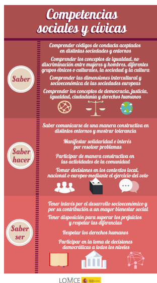
Figura 3. Competencias sociales y cívicas. Ministerio de Educación, Cultura y Deporte de España. [ http://mecd.gob.es/educacion-mecd/mc/lomce/el-curriculo/curriculo-primaria-eso-bachillerato/competencias-clave/cultura.html ]

La competencia para la conciencia y expresiones culturales; y, las competencias sociales y cívicas, principalmente, proponen expectativas para pensar que el sistema educativo español cuando concibe la educación permanente contempla el aprendizaje que favorece en el alumno actitudes para su participación activa en la legitimidad del patrimonio cultural, de sus señas de identidad.