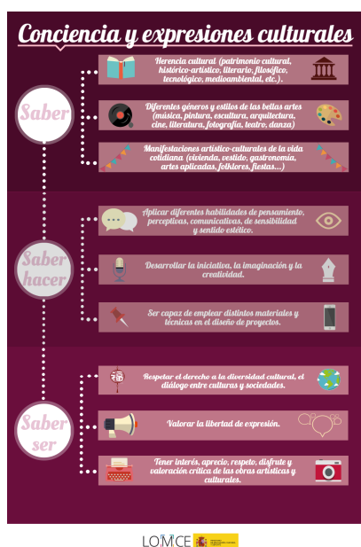
Figura 2. Competencia en conciencia y expresiones culturales. Ministerio de Educación, Cultura y Deporte de España. [ http://mecd.gob.es/educacion-mecd/mc/lomce/el-curriculo/curriculo-primaria-eso-bachillerato/competencias-clave/cultura.html ]

Así mismo, la Recomendación contempla en el aprendizaje permanente las competencias sociales y cívicas, las define “formas de comportamiento que preparan a las personas para participar de una, las define “formas de comportamiento que preparan a las personas para participar de una a eficaz y constructiva en la vida social y profesional, especialmente en sociedades cada vez más diversificadas, y, en su caso, para resolver conflictos. Las competencias sociales y cívicas procuran la comprensión de códigos de conducta en distintas sociedades y entornos, en este objetivo interpretamos el patrimonio cultural en la medida en que éste se identifica con las señas de identidad de una comunidad cultural. La competencia cívica prepara a las personas para participar plenamente en la vida cívica gracias al conocimiento de conceptos y estructuras sociales y políticas, y al compromiso de participación activa y democrática” Recomendación 18/diciembre de 2006 (Diario Oficial de la Unión Europea 20/12/20106. L394/16).