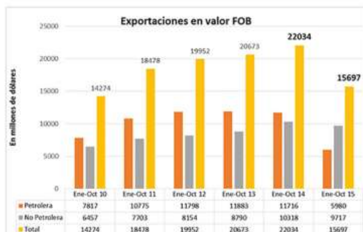
Gráfico 2. Exportaciones FOB del Ecuador 2010 - 2015

Estos hechos se reflejan en el desplome de las exportaciones que, de octubre de 2014 a octubre de 2015, cayeron en un 29% al pasar de $ 22.034 millones a $ 15.698 millones.