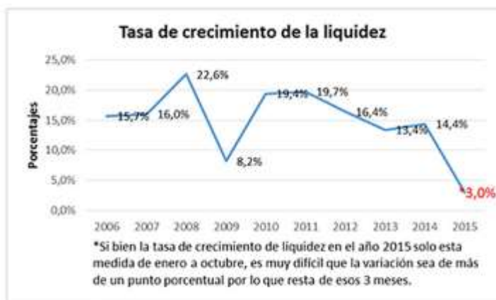
Gráfico 3. Tasa de crecimiento de la liquidez