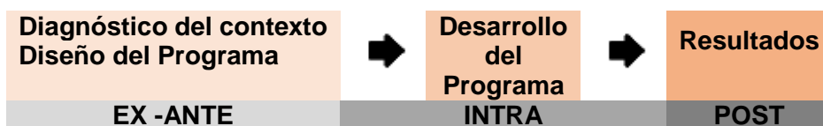
Figura 3.1: Contexto y evaluación del impacto

En consecuencia se ha asumido la complementariedad metodológica, conjugando el uso de un enfoque cuantitativo, más adecuado para medir efectos finales y cuantificables; con el enfoque cualitativo, más apropiado para la interpretación de los significados y la obtención de visiones generales más profundas, con objeto de mejorar el desarrollo y la implementación de los programas. Partimos de un estudio exploratorio para el análisis del contexto y un estudio analítico en profundidad para constatar la adecuación de los recursos y medios de los Programas a la consecución de los objetivos. Igualmente en esta segunda fase evaluamos la satisfacción con la formación