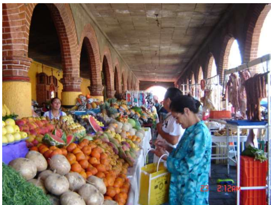
Foto 20 A. Mercado en Tenango del Aire, Edo. México.