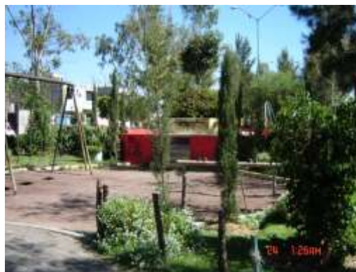
Fotos. 1 y 2. Camellón en Av. Nezahualcóyotl, NEZA

De aquí, es necesario lograr que las instituciones abocadas a la enseñanza orienten su atención a las actividades productivas, haciendo suya la tarea de lograr mayor productividad y mayor apertura al trabajo conjunto con las comunidades agrarias y urbanas, sin omitir la diversidad de microclimas que se encuentran en el área metropolitana de la Ciudad de México, y del país; de manera que los programas de investigación tendrían que tener mayor coordinación y estar orientados al compromiso de servicio de los estudiantes y egresados de las instituciones educativas de nivel medio, medio superior y superior, quienes tienen la responsabilidad de participar en su región o en su localidad.