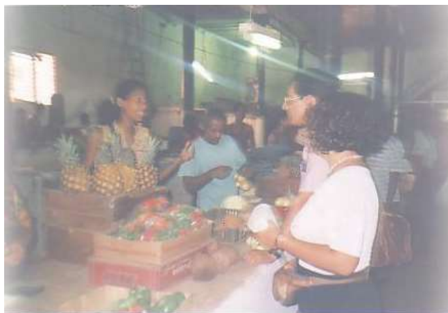
FOTO 10. Agromercado. Centro de la Habana, Cuba

pedagógica orientada a la capacitación, (más acción y menos discurso) en la búsqueda de solucionar los problemas identificados por la propia comunidad rural a través de su organización de tipo empresarial autogestionaria, promoviendo el salto cualitativo de la conciencia ingenua y/o crítica hacia la conciencia organizativa, en la búsqueda del quehacer para avanzar en la construcción de un modelo de sociedad que además de económicamente viable y económicamente equilibrada, sea socialmente justa”. 339 Aplicando en su metodología la investigación-acción.