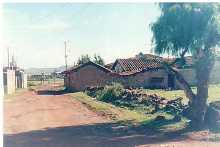
FOTO. 16. Área periurbana de Chignahuapan, Puebla, México