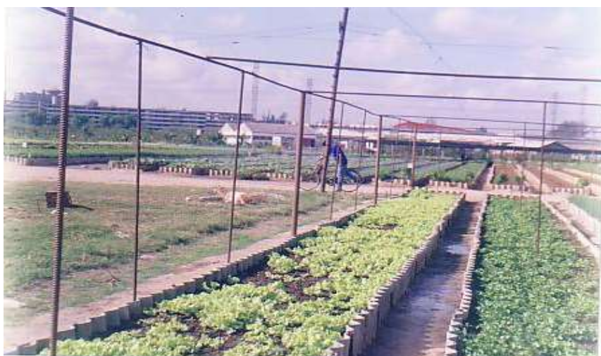
FOTO13. Detalle del Organopónico en Boyeros, área periurbana de la Ciudad de la Habana, Cuba