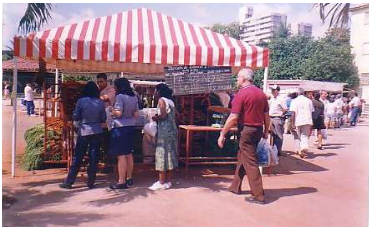
Foto. 7. Agromercado