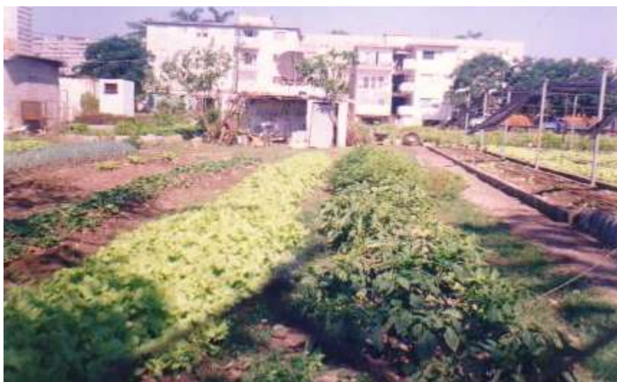
FOTO 14. Preparación de Tierra en la Producción de Hortalizas. Organopónico del MINAGRO