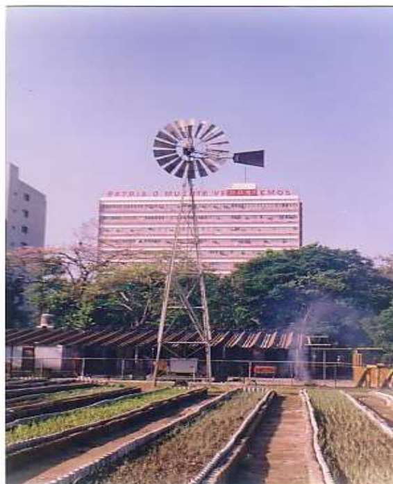
FOTO 12 Organopónico del Ministerio del interior. La Habana