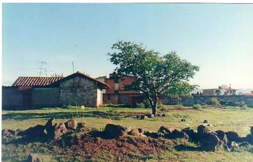
FOTO 19. Área periurbana en Chignahuapan, Puebla