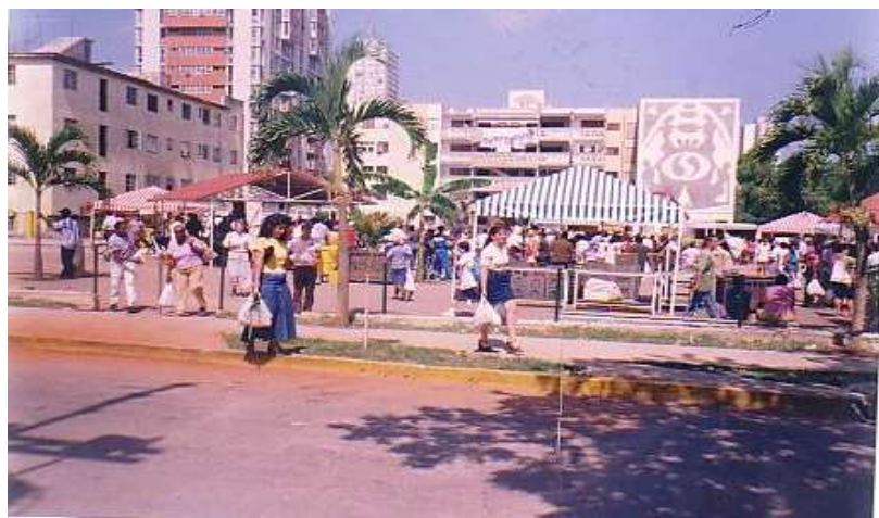
Foto. 6. Agromercado en la Habana