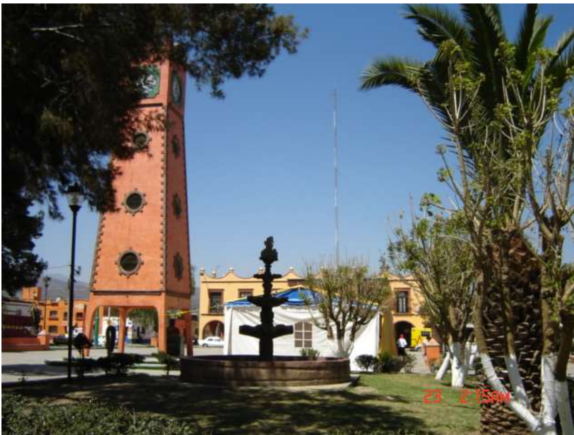
Foto. 17. Plaza Principal de Tenango del Valle, en la ROEM