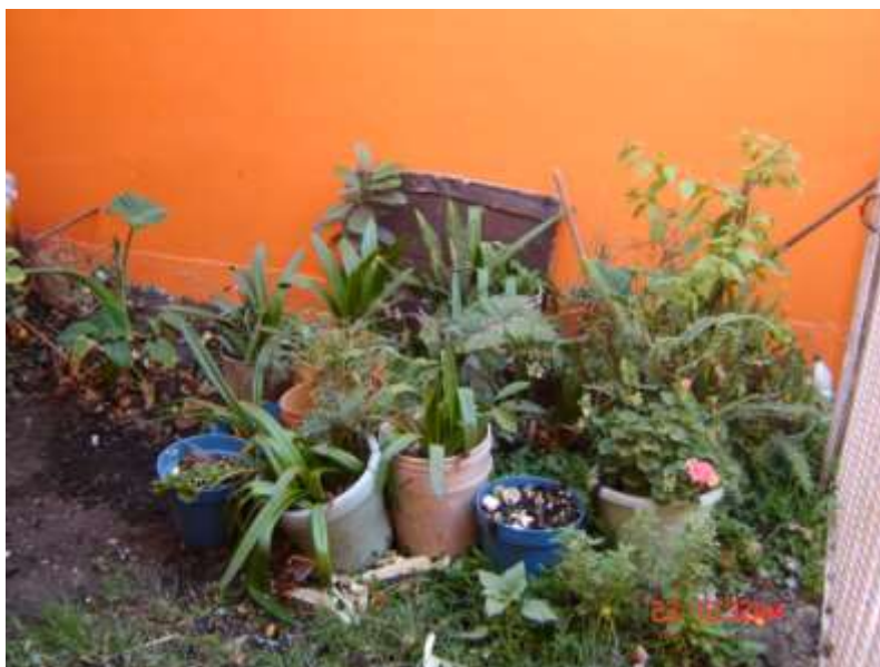
Foto 20. Cultivo de plantas medicinales. Ejemplo de Agricultura Urbana de traspatio en la ciudad.