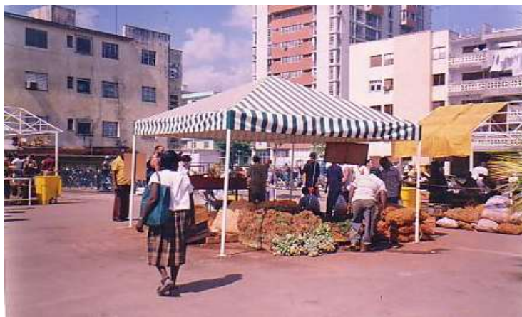
FOTO 11. Barrio Residencial y agromercado ambulante