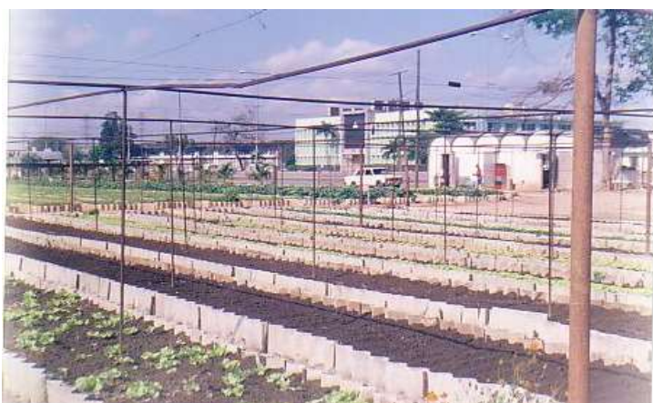
FOTO. 15. Detalle de centro productor de hortalizas en área periurbana en la Habana, Cuba

Para Villanueva (2005) es importante "aplicar una política municipal, generar normas y regulaciones. Sobre desarrollo urbano y asentamientos urbanos. Incorporar las necesidades de los actores sociales a la plantación, recuperando los ecosistemas destruidos y edificando bases para construir una sustentabilidad social y ambiental en el municipio. Incluyendo con rigidez legal a los pobladores, promoviendo una cultura de interés y de conciencia; contando con apoyo financiero, logístico de diversas instituciones de diversos niveles, con visión compartida por todos: fortaleciendo la cooperación en distintas organizaciones y la necesidad de estudios históricos ambientales en general.