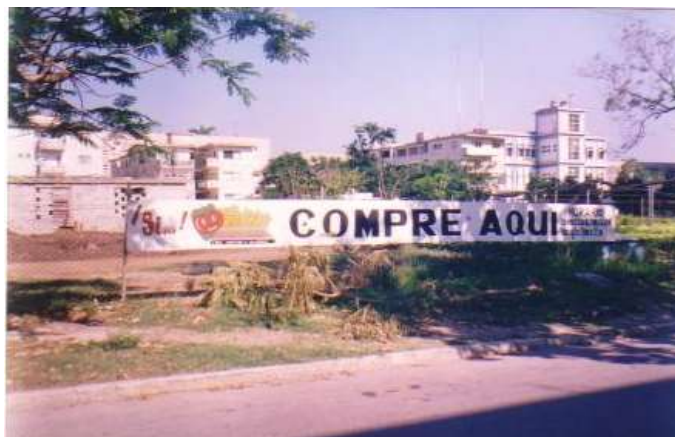
Foto 5. Organopónico en el centro de la Habana

enteradas y posibilita no incurrir en errores y evitar duplicidad en el trabajo tanto de investigación como de programación de acciones ambientales y productivas.