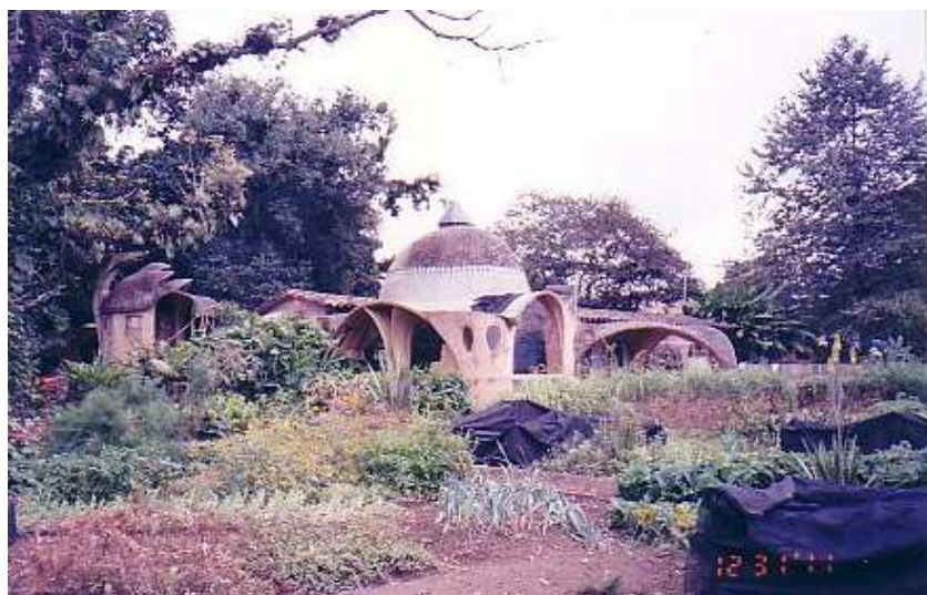
FOTO 18. Casa ecológica en Huatusco, Veracruz, México

responsables en vastas áreas de la vida cotidiana. Constituida la nueva urbanidad en articulación con la vida rural, en una simbiosis compatible que sea una alternativa de vida realmente sustentable.