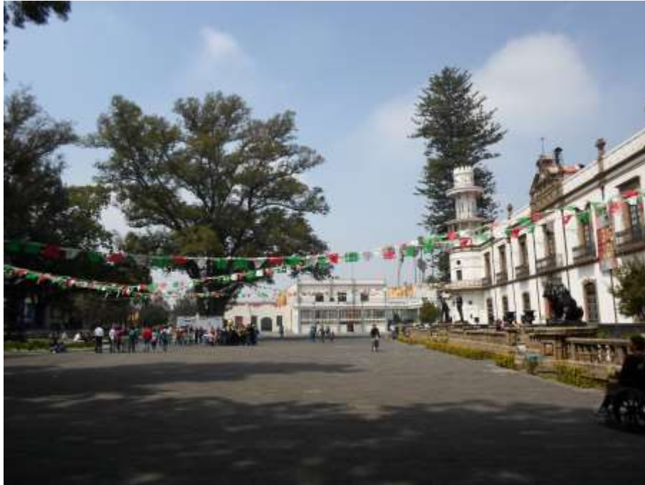
Explanada y rectoría Universidad Autónoma Chapingo/2012

Es manifiesta una crisis en los límites estrictos de las disciplinas sociales, - se ha dicho de lo necesario que es arribar a la transdisciplina, y a la hibridación disciplinaria; así como el constante hacer de propuestas metodológicas compartidas. Lo fascinante de la disciplina científica en general, son las dimensiones sociales, económicas, políticas, ideológicas, territoriales, espaciales, biológicas y culturales articuladas, para la explicación de lo comúnmente llamado lo humano.