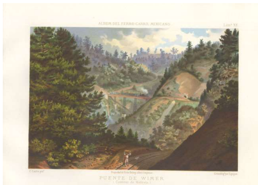
Puente de Wimmer, construido en las Cumbres de Maltrata, Ver. , en la segunda mitad del siglo XIX y preservado hasta la actualidad, (Casimiro Castro, cromolitografía, 1877)