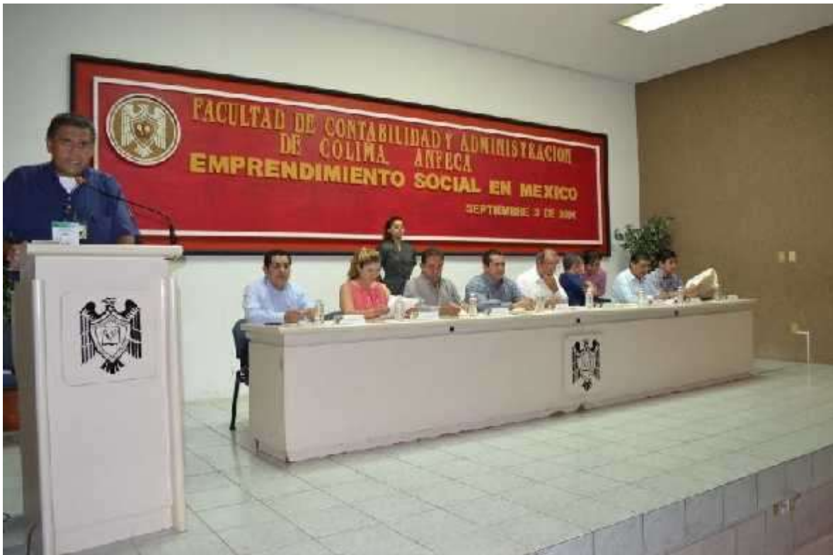
Imagen 1. Presentación del presídium, en la inauguración del evento.

La Asociación Nacional de Facultades y Escuelas de Contaduría y Administración (ANFECA) y la Facultad de Administración de Colima de la Universidad de Colima, da la cordial bienvenida a todos ustedes al segundo encuentro estudiantil de intercambio académico “Emprendimiento social” en esta ocasión, nuestra facultad y la Universidad de Colima han sido designados como sedes del encuentro los días 3, 4 y 5 de este mes de Septiembre.