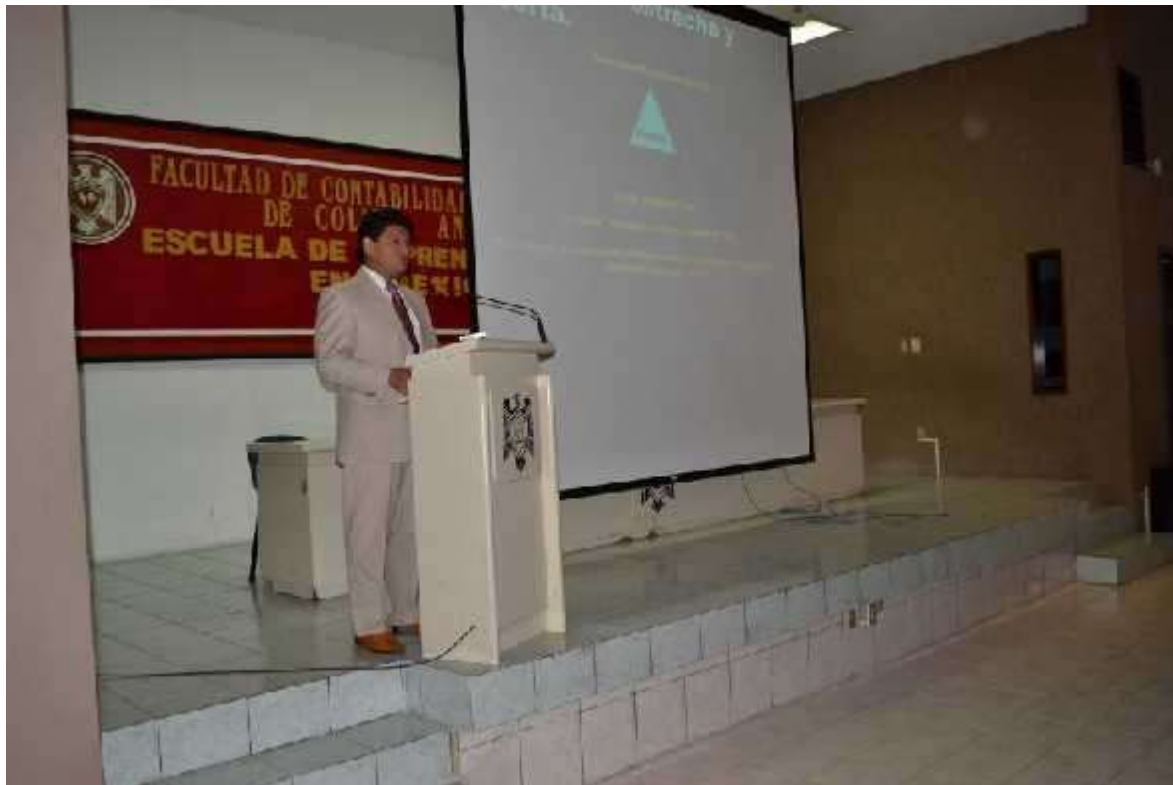
Imagen 6. Conferencia “Emprendimiento social entre quimera y utopía”

Lugar: Auditorio “Lic. Carlos de la Madrid Virgen” FCA Colima.