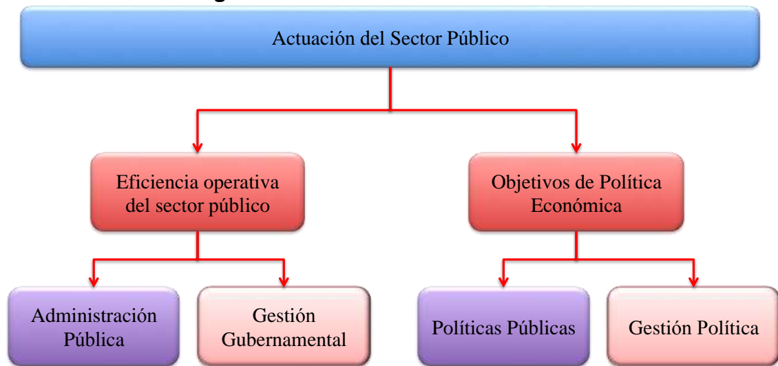
Figura 2. Actuación del Sector Público

El esquema siguiente explica lo anterior.