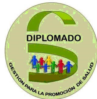
Programa de Promoción de Salud