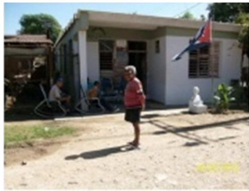
Las Casas de Abuelos