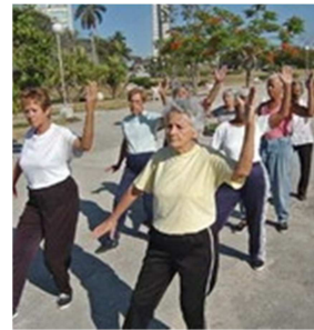
Las Cátedras Universitarias del Adulto Mayor