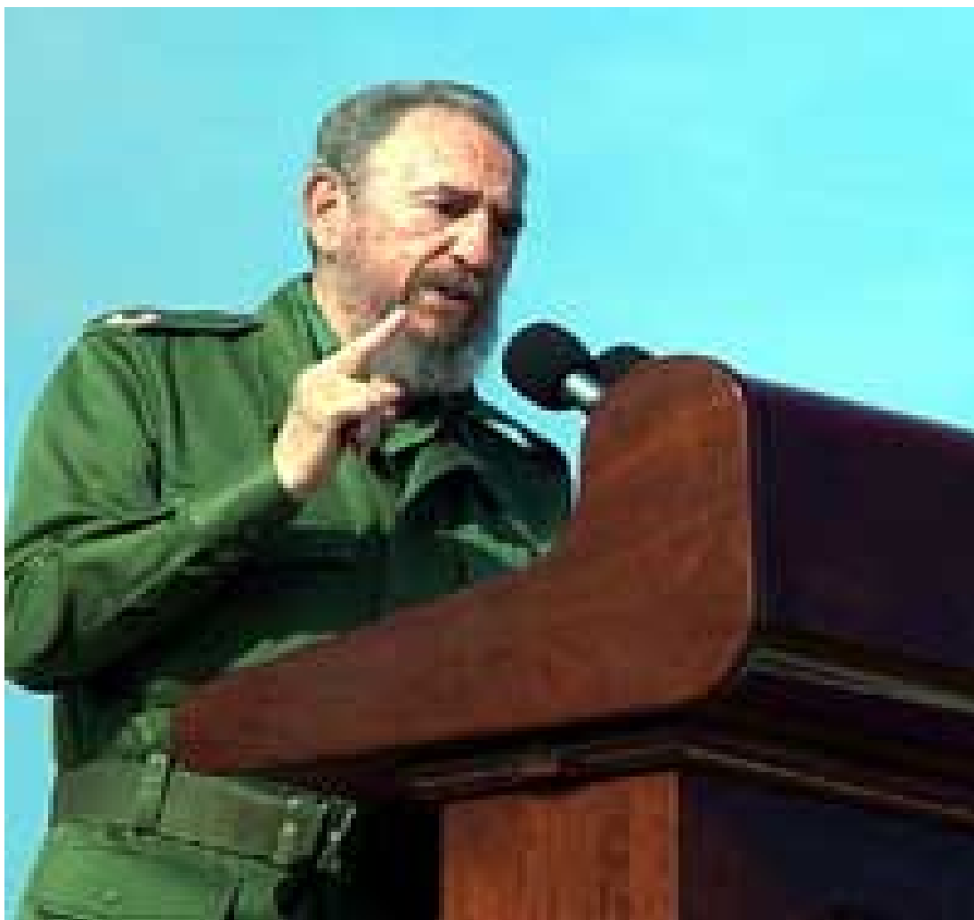
Fidel Castro Ruz

"Y la naturaleza hizo a la mujer más débil físicamente, pero no la hizo inferior al hombre moralmente e intelectualmente."