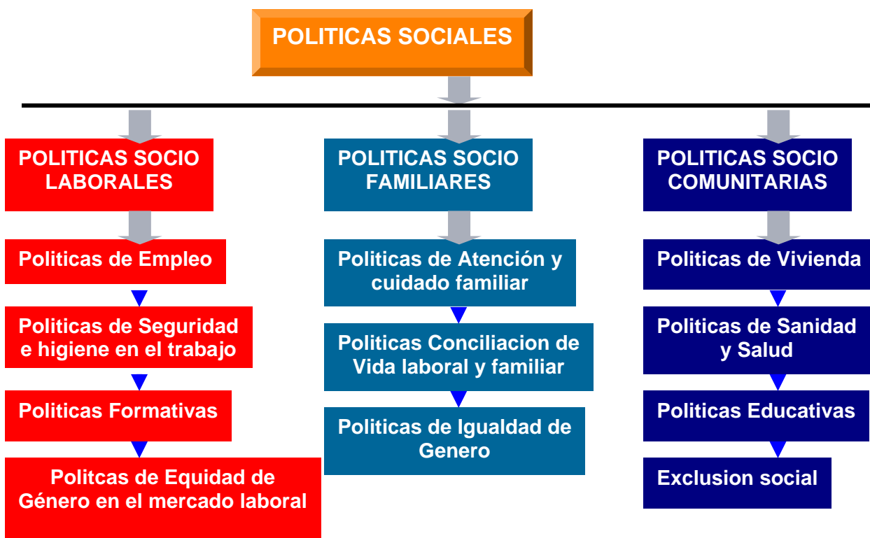
Figura II.1: Posible Clasificación de las Políticas sociopublicas

Dentro de las Políticas Socio-Públicas (una propuesta de clasificación de las mismas puede encontrarse en la figura II.1, aneja) se han destacado tradicionalmente los segmentos de educación, salud y acceso a la vivienda, incorporándose con carácter más reciente las condiciones del mercado de trabajo, donde podría incluirse a la Conciliación de las Esferas Laboral y Familiar, prototipo de las políticas socio-publicas de segunda generación, que han comenzado a implementarse con carácter general en la Europa Continental y Nórdica a partir de la década de los noventa (Flaquer, 2000) 27 . La cobertura social en dichos segmentos de actuación, parece contribuir decisivamente al desarrollo integral de las personas en su quehacer cotidiano (Moreno, 2003) 28 .