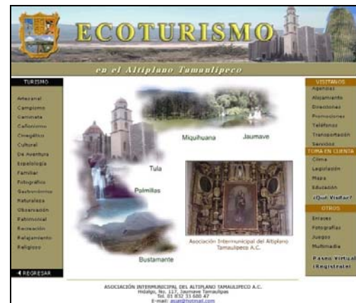
Imagen 4. Página Principal.