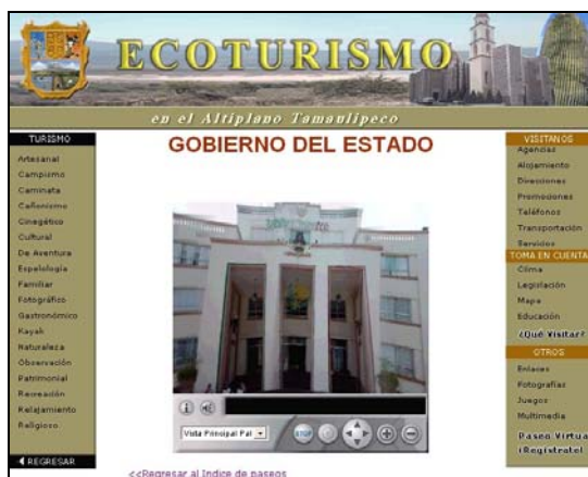
Imagen 5. Página Paseo Virtual.