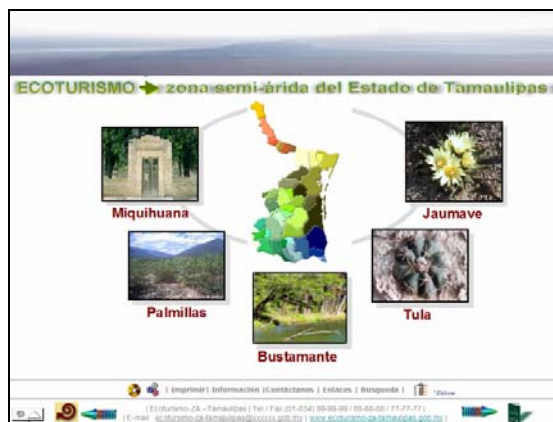
Imagen 1. Bosquejo de la Página Inicial