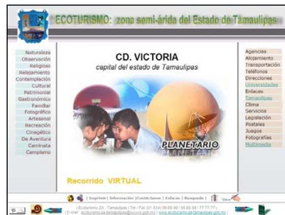
Imagen 2. Bosquejo de Página Principal.