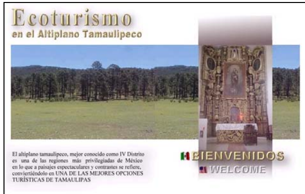
Imagen 3. Página Inicial.