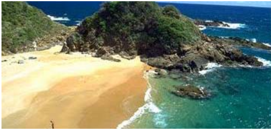
Playas Vírgenes de Huatulco.