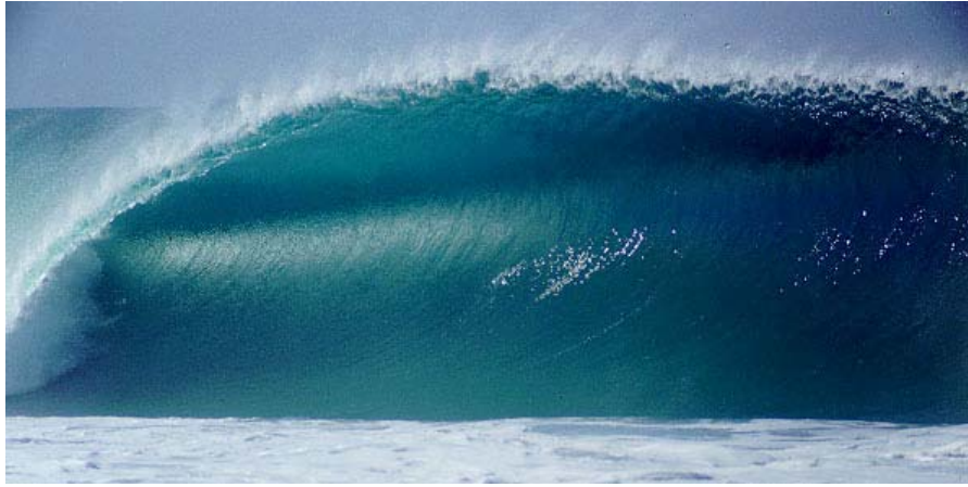
Olas de Zicatela Puerto Escondido