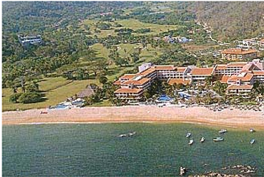
Vista Panorámica del Complejo Turístico de Huatulco.

Cabe indicar que el turismo nacional y extranjero por lo regular se establece en la capital del estado, en virtud de que cuenta con todos los servicios: aeropuertos y terminales de autobuses de primera clase, hoteles, restaurantes y discotecas, por lo que ubican en esta ciudad su centro de estancia y de ahí trasladarse a los diferentes puntos turísticos relativamente cercanos.