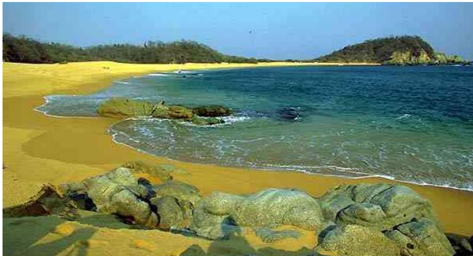
Playas Vírgenes de Huatulco.

Asimismo, destaca como punto turístico Puerto Escondido, equipado con un aeropuerto internacional y con buena infraestructura hotelera y restaurantera. De esta población parte el turismo que lo visita, hacia otros lugares de gran atractivo natural: las diferentes playas Mazunte, Puerto Angelito, Zicatela y Zipolite, entre otras, así como lagunas y lugares de atractivo turístico.