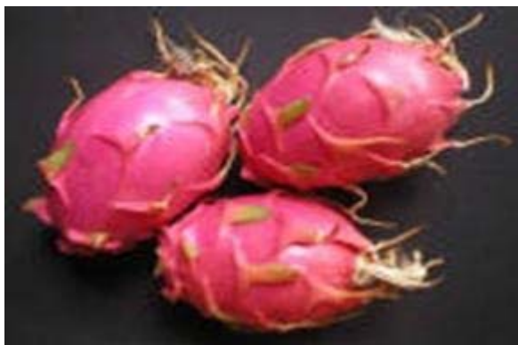
Pitajayas o Pitahayas

Asimismo, se tiene la existencia de otras variedades de árboles frutales en casas particulares y en el campo, como son: el guamuchil, limonares, limas, naranjales, toronjas, guayabas, mangos, tinados, nogales y aguacatales, entre otros, cuya producción es por lo regular para consumo familiar y en menor medida para el comercio local.