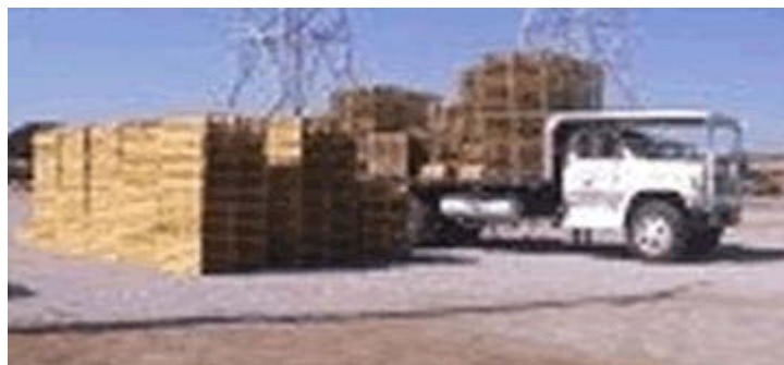
El Comercio Maderero

autoridades municipales y con el riesgo de hacerse presente representantes de las instancias correspondientes para asegurarles sus mercancías.