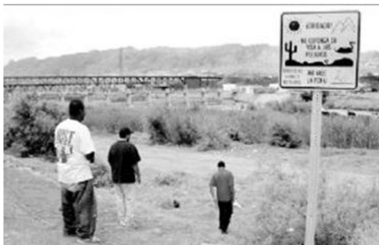
El Fenómeno Migratorio hacia los Estados Unidos de Norteamérica

Al adolecer de fuentes de trabajo u otras opciones para mejorar los niveles de vida de las familias, no ha quedado otra que la migración, que se da hacia otras entidades del país, incluyendo la capital del estado y del país, pero sobre todo a los estados del norte de la república o bien a los Estados Unidos de Norteamérica, donde pasan de manera ilegal, con todas las agravantes que significan laborar en dicha nación.