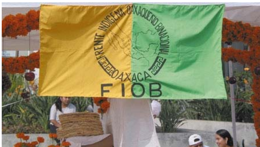
Frente Indígena Oaxaqueño Binacional

realidad social, política y económica de las poblaciones, sino que al contrario, entorpecen más las condiciones de tal forma que no hay avances, sino estancamiento 31 y a la postre desconfianza.