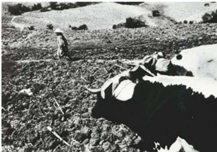
La Agricultura Temporalera en la Mixteca

Las actividades de este sector se encuentran firmemente ligadas a la propiedad, sea esta privada, comunal o ejidal; pese a la reforma que sufriera el artículo 27 Constitucional, el patrimonio familiar de los campesinos, conformado por 219 núcleos agrarios 17 ligado a sus tierras, les permite mantener la seguridad de contar con “algo” para su subsistencia, ese “algo” que les pertenece y que lo pueden trabajar para enfrentar la supervivencia familiar.