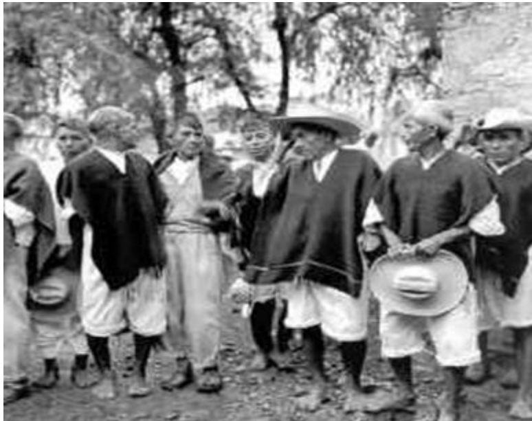
Prevalece la Incertidumbre e Inseguridad ante los conflictos Agrarios

Al adolecer de fuentes de trabajo u otras opciones para mejorar los niveles de vida de las familias, no ha quedado otra que la migración, que se da hacia otras entidades del país, incluyendo la capital del estado y del país, pero sobre todo a los estados del norte de la república o bien a los Estados Unidos de Norteamérica, donde pasan de manera ilegal, con todas las agravantes que significan laborar en dicha nación.