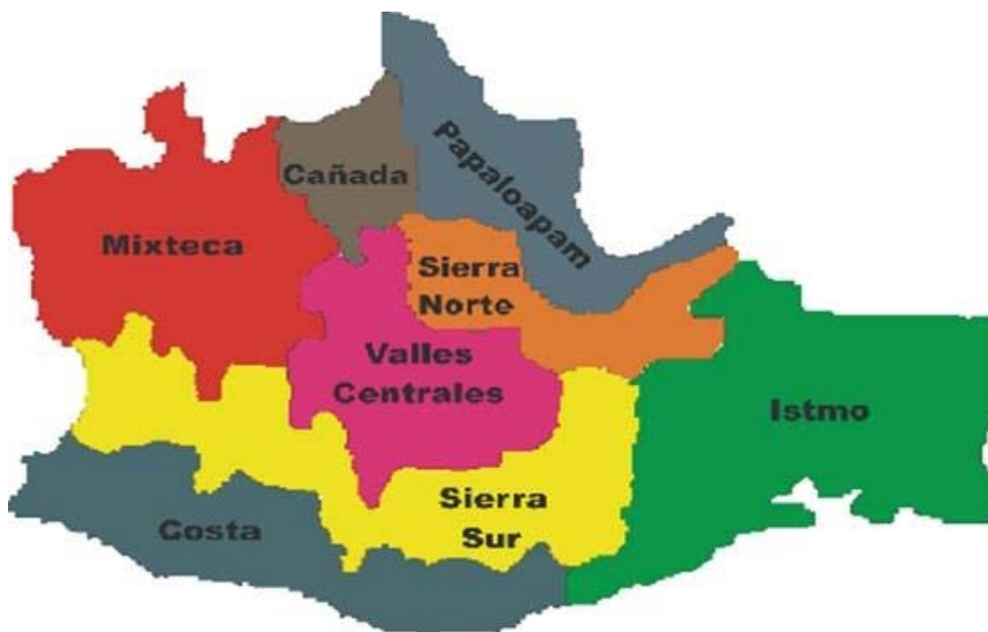
Las ocho regiones del Estado de Oaxaca.

La Nación Mixteca o Ñuu Savi (Pueblos de la lluvia o de las nubes), se encuentra conformada por un territorio que en la actualidad abarca parte de los estados de Guerrero, Puebla y Oaxaca; para el caso del estado de Oaxaca, la región Mixteca se encuentra dividida en tres partes: la Mixteca Alta, que comprende los distritos de Coixtlahuaca, Nochixtlán, Teposcolula y Tlaxiaco; la Mixteca Baja, esta conformada por los distritos de Huajuapam, Juxtlahuaca y Silacayoapam; y la Mixteca de la Costa, diseminada por pueblos asentados en la región de la Costa, además de localizarse otras poblaciones mixtecas en diferentes partes de la entidad, como en las regiones del Istmo, los Valles Centrales y la Cañada.