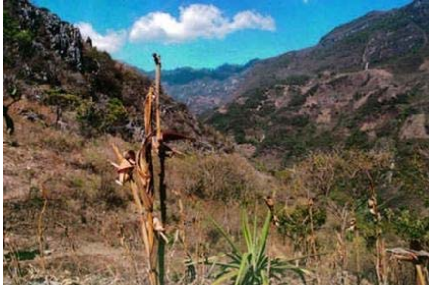
Parte de la orografía de la Región Mixteca