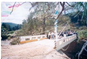
Puente Sobre camino Rural