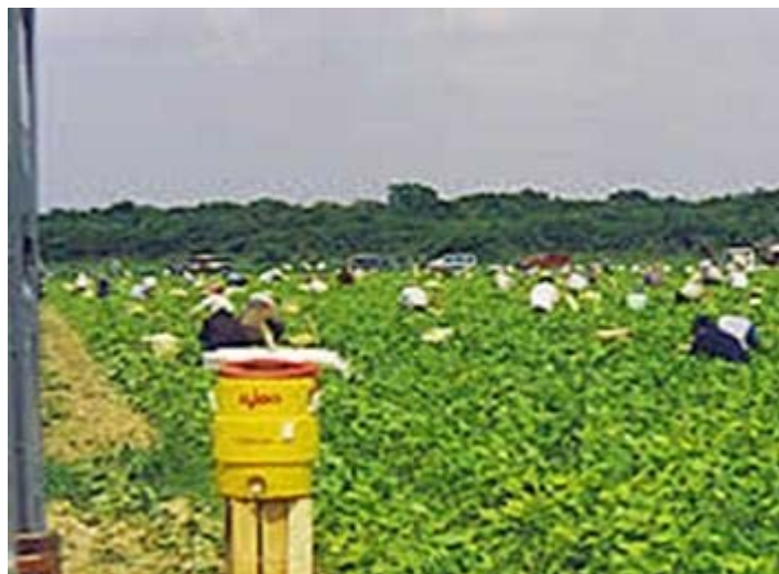
Trabajadores Migrantes en Campos de E.U.

La mano de obra que no se ocupa en estas actividades en la Región Mixteca, emigra a otros estados del país o bien a los Estados Unidos de Norteamérica, en busca de lograr mejores expectativas para sus familias, abandonando sus tierras, convirtiéndolas en ociosas.