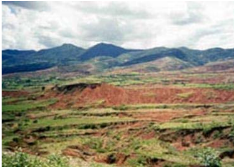
Zona afectada por la erosión en la región Mixteca

Asimismo, señalaba el estudio, que las pérdidas de suelo por efecto de la erosión pluvial, variaba de 4.1 hasta 30/ton/ha/año, de suelo perdido, dependiendo de la cobertura vegetal, textura del suelo y la pendiente del terreno 3 .