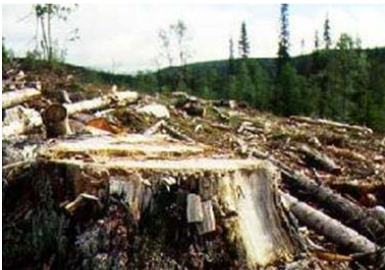
Explotación Irrracional de los Bosques

Por el alto grado de ignorancia e inocencia, por parte de las comunidades y la existencia de diferentes organizaciones sociopolíticas, así como el abuso de los inversionistas, para explotar la riqueza forestal, se registran casos de la existencia de aserraderos que operan de manera clandestina 25 o que en el mejor de los casos, éstos no se encuentran regulados o no existen dentro de las listas oficiales.