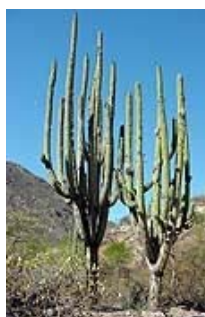
Órganos en la Mixteca