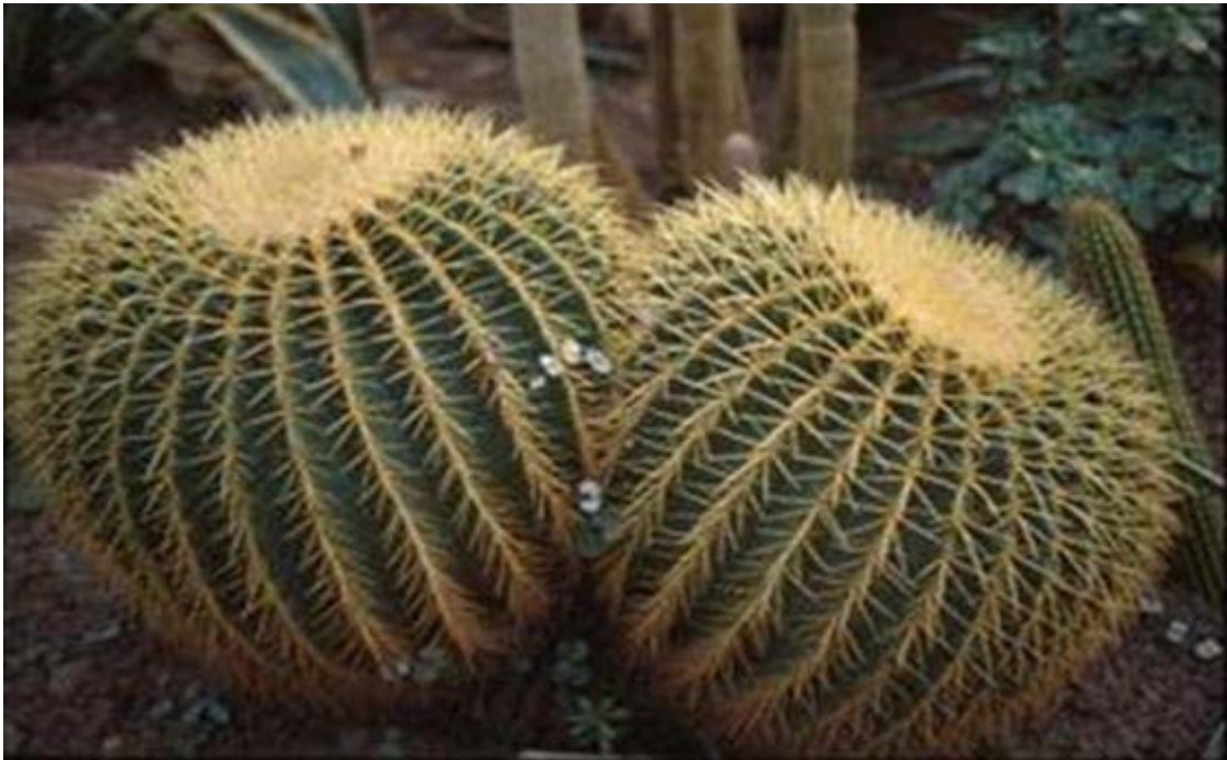
Cactus Siameses, característicos de la Mixteca

Mixteca Alta: en ella se encuentran magueyales, nopaleras, matorral espinoso, mezquite, bosques de pino y encino, pastos nativos.