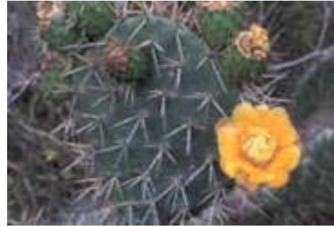
Flora silvestre de la Mixteca

Mixteca Alta: en ella se encuentran magueyales, nopaleras, matorral espinoso, mezquite, bosques de pino y encino, pastos nativos.