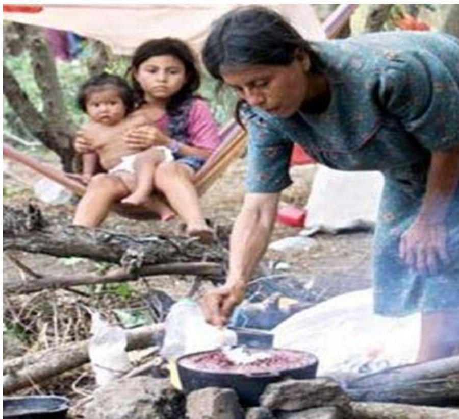
Marginación y Pobreza

alcanzar mejores niveles de vida para las poblaciones, orillándolos a abandonar sus tierras y optar por la migración 27 .