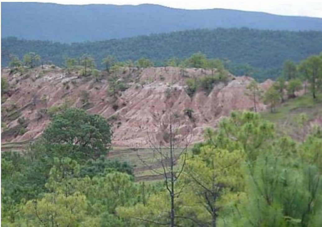
Vista parcial de una zona afectada por la erosión en un bosque de pino

La característica principal es la de tener una orografía predominantemente agreste, toda vez que en la Región de la Mixteca coinciden la Sierra Madre del Sur y la Sierra de Oaxaca, conformando el denominado Nudo Mixteco, que por los efectos de fenómenos naturales, como la lluvia y la acción depredadora del ser humano, al practicar la roza, tumba y quema para preparar las tierras y cultivarlas, la explotación irracional de las áreas forestales, los incendios forestales y el sobrepastoreo, se ha visto acentuado el fenómeno de la erosión, principalmente en las jurisdicciones de los distritos de Coixtlahuaca, Nochixtlán y parte de Tlaxiaco, no obstante a ello, cuenta con algunos valles en las jurisdicciones de Nochixtlán, Teposcolula y Coixtlahuaca, principalmente, que se aprovechan para la práctica de la agricultura.