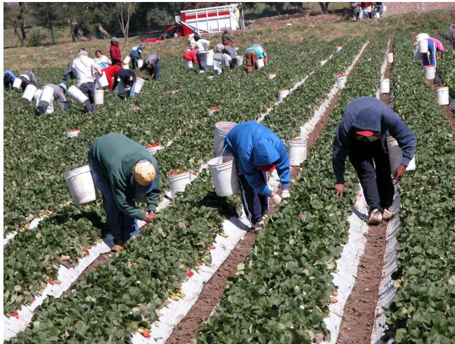
Figura 2.- Trabajadores mexicanos en EUA, son muy solicitados por que es la mano de obra más barata.

respecto a EUA y Canada. Un acuerdo complementario al TLCAN creo instituciones para tratar los asuntos laborales, éste fue el ACLAN (Acuerdo de Cooperación Laboral de América del Norte), fue el primer acuerdo comercial en incluir disposiciones laborales. A pesar de todas las esperanzas que otorgo el TLCAN y el ALCAN, solo hubo resultados negativos para la mano de obra mexicana. El crecimiento laboral fue muy poco, los salarios, a diferencia de EUA y Canadá, en México ha disminuido. 13 Si México se propusiera elevar el costo de su mano de obra tendría que generar y promover programas mas atractivos a inversionistas mexicanos para así elevar las exportaciones, captar mas ganancias y poder remunerar mejor a los trabajadores, de esta manera se irían creando paulatinamente mas empresas exportadoras y mayor generación de empleo.