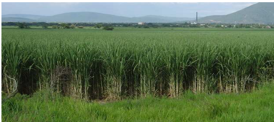
Figura 3.- Campos de caña mexicanos.

México tenía probabilidad de seguir como importador neto o convertirse en exportador neto. El gran problema fue que las empresas mexicanas que utilizan endulzantes para sus productos, principalmente emplean el azúcar en lugar de edulcorante de maíz que resulta mucho más barato y por ese motivo México no puede exportar el azúcar como debería, porque toda se queda en el país. 18 La solución para que México se convirtiera en exportador neto sería incentivar a las propias empresas mexicanas a utilizar el edulcorante de maíz en sus productos y así elevar las exportaciones de productores mexicanos, de esta manera al cabo de 2 años México se convertiría en exportador neto y mejoraría la economía mexicana.