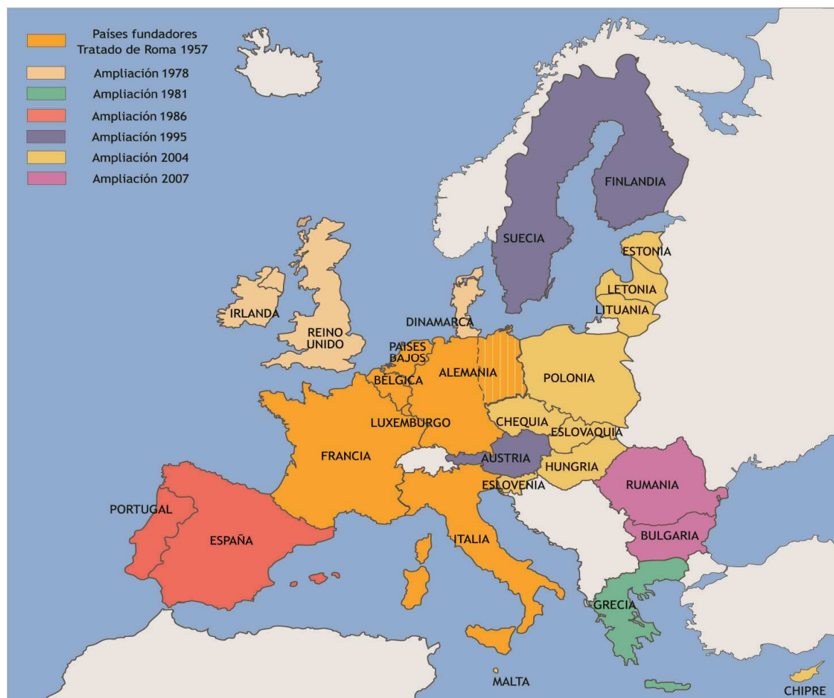
Figura 4.- Mapa de la unión Europea. Disponible en

< http://s335272561.mialojamiento.es/CD/contenidos/m7/172871_jpg_1.jpg > (Consultado junio 2013)