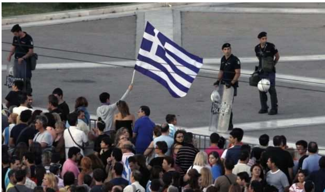
Figura 5.- Imagen de los disturbios en Grecia a causa de la crisis.

Disponible en < http://i2.esmas.com/editorial-televisa/2012/02/15/336669/grecia-crisis-626x367.jpg > (Consultado Junio 2013)