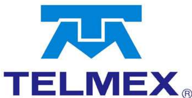
Figura 1.- Telmex perteneció al gobierno mexicano antes de integrarse al sector privado.

Con respecto a cuando el gobierno mexicano aprobó el TLCAN, se llevo a cabo la privatización de Telmex (Teléfonos de México) como consecuencia de su compromiso con el tratado. Con la privatización de la empresa se demostró el rompimiento de la tradición nacional revolucionaria, así mismo se decidió impulsar un capitalismo dirigido por el sector privado. Aun así se temía que la empresa sufriera un proceso de desnacionalización o fuera víctima de la competencia fuerte, principalmente de EUA. La decisión de privatizar la empresa fue para tomarla como un monopolio, y se establecieron condiciones para que la mayor parte de la inversión en ella fuera mexicana. 11 Si este tipo de empresas se desprivatizaría y fuera patrimonio de los mexicanos, ayudaría en la economía de los mexicanos ya que es un monopolio en las telecomunicaciones y aplica tarifas muy altas, y al pasar a propiedad del gobierno mexicano ofrecería una tarifa mas baja. Y sería el mismo caso en las demás empresa.