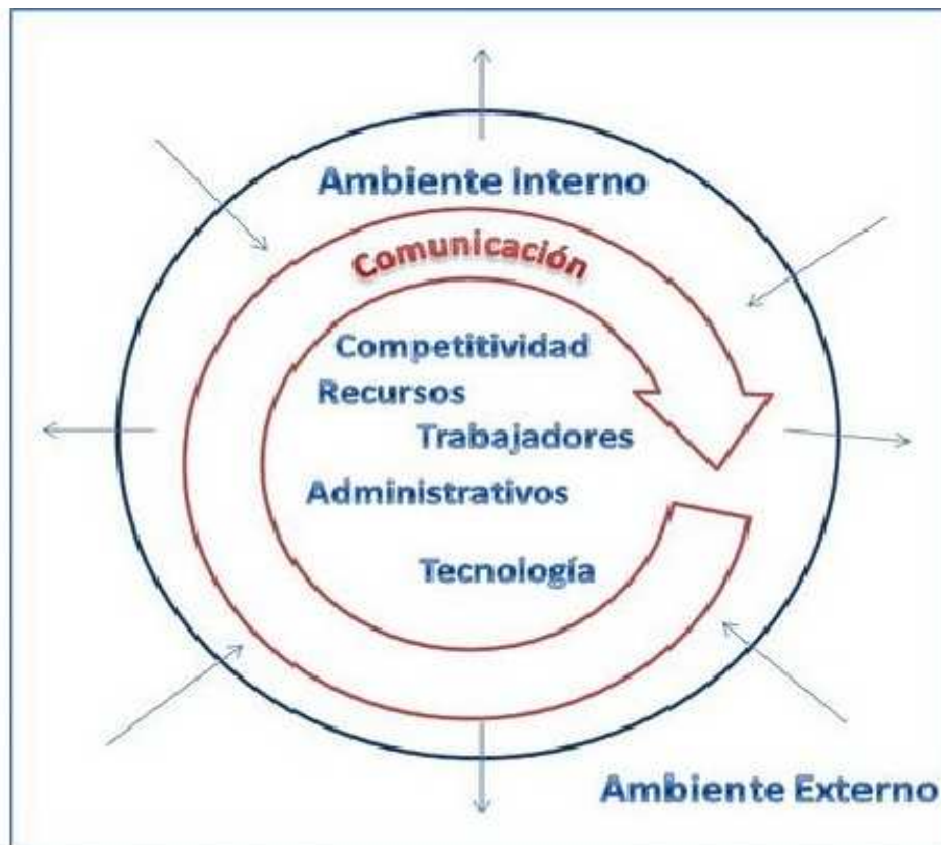
Figura 4 Elementos que forman parte del ambiente interno de una empresa. 12

En el ambiente interno se clasifican todas las cosas que la empresa puede controlar y así poder realizar las estrategias de mercado adecuadas, las organizaciones poseen personas que toman las decisiones y las elaboran las tareas necesarias. 13 La mano de obra es importante para la empresa en especial para una empresa pequeña ya que esta deberá desempeñar un trabajo más meticuloso y especializado debido al número reducido de empleados. La competitividad de las PYMES depende la calidad de los recursos humanos que tienen a su disposición que constantemente está en capacitación y desarrollo debido al tipo de necesidad que tiene la empresa, sin embargo en la actualidad ha surgido una idea que habla sobre la vida útil de un trabajador se reduce cada vez más ya que pierde sus conocimientos y habilidades de manera veloz, es por eso que los empresarios deben de tener políticas que permitan asegurar la constancia de los empleados, y para lograr esto durante la búsqueda de empleados, los gerentes no solo deben elegir a los candidatos más aptos sino también sus esfuerzos necesitan enfocarse a una de confiable política de formación. La pérdida de la productividad está relacionada con la rotación del personal esto ocasiona que las empresas se