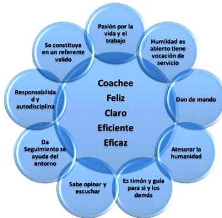
Figura 5 Conceptos principales para lograr el liderazgo emocional: Fuente liderazgo emocional, Boyatzis Richard y Mckee Annie.