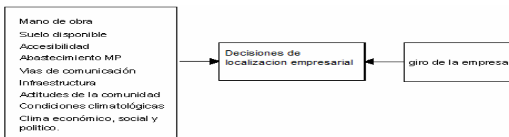
Gráfico 1. Modelo conceptual de la localización empresarial. 24