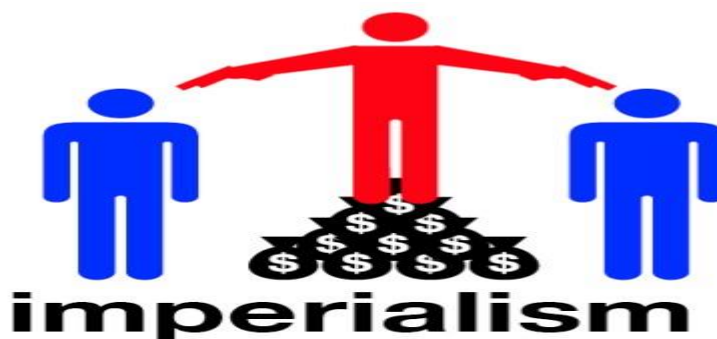
Figura 9, imperialismo ( http://tardecilla.blogspot.mx/2010/09/sistemas-politicos-en-una-imagen.html ), consultado el 24 de abril de 2014.

En una región donde existen diferencias tanto económicas como sociales y políticas es muy difícil o más bien imposible poder llegar a un común acuerdo en el que todos sean beneficiados, la solución sería la honestidad y buscar el interés continental y no el individual, en donde todas las naciones ofrezcan su mayor esfuerzo en temas de desarrollo social, financieros y educativos para poder crear un bloque económico competitivo a nivel global en el cual exista la autosuficiencia y no depender tanto de las próximas potencias de oriente.