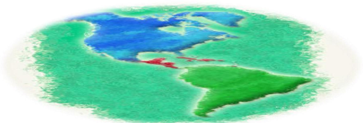
Figura 6, america y sus diferentes formas de pensar, ( http://www.me.gov.ar/efeme/america/paises.html ), consultado el 24 de abril de 2014.

Es bien sabido que dentro del continente americano existen distintas áreas geográficas en las cuales se pueden nombrar Norteamérica; centro y Caribe, y Sudamérica (América Latina), dentro de estas últimas, se conoce que existen similitudes respecto a rasgos entre los países latinoamericanos, pero cada nación tiene bien arraigada su cultura, sus tradiciones, su música, su comida, su literatura y sobre todo la ideología política. (José Ángel Sotillo, 2006)