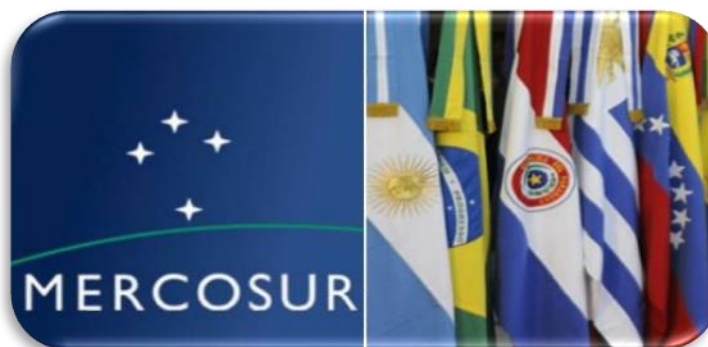
Figura 3, Mercado Común del Sur (MERCOSUR) ( http://entreeelbarrioyelmundo.wordpress.com/2013/08/16/apuntes-sobre-paraguay-y-su-situacion-actual-en-el-mercosur/comment-page-1/ ) consultado el 23 de abril de 2014.