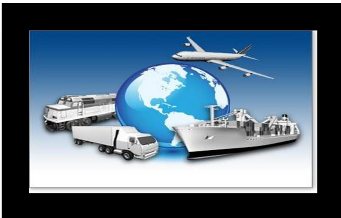
Figura 1, comercio en America

Mexico, Latin America, United States of America, trade agreements.