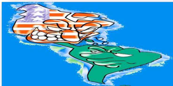
Figura 7, dominio, ( http://grupolujan-circus.blogspot.mx/2011_10_01_archive.html ), consultado el 24 de abril de 2014.

El problema resulta muy complicado por el hecho de que, en las actuales condiciones, el antiguo proteccionismo, además de prácticamente fuera del poder de los países débiles, presenta efectos negativos, por exacerbar el retraso tecnológico y la carencia de capitales.