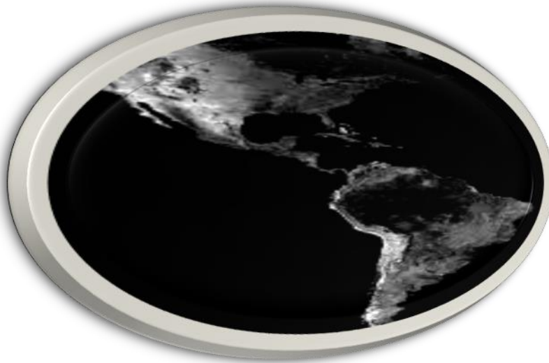
Figura 4, Continente americano (ALCA) ( http://www.mapadaamerica.com/CONTINENTE-AMERICANO.html ) consultado el 24 de abril de 2014.

Fue una propuesta de integración comercial y económica dirigida a Latinoamérica y el Caribe por los Estados Unidos de América en la década de los noventa, en esta se promovía la inversión, reducción en las barreras arancelarias y el acceso a mercados, bienes y servicios de intercambio comercial entre los países del continente, excluyendo a Cuba; y que además ayudaría a la reducción de la deuda con los Estados Unidos de América. Entre otros temas se está discutiendo acerca de la inversión extranjera, privatización de bienes y servicios públicos, agricultura, derechos de propiedad intelectual, subsidios y medidas antidumping, libre competencia y resolución de diferencias.