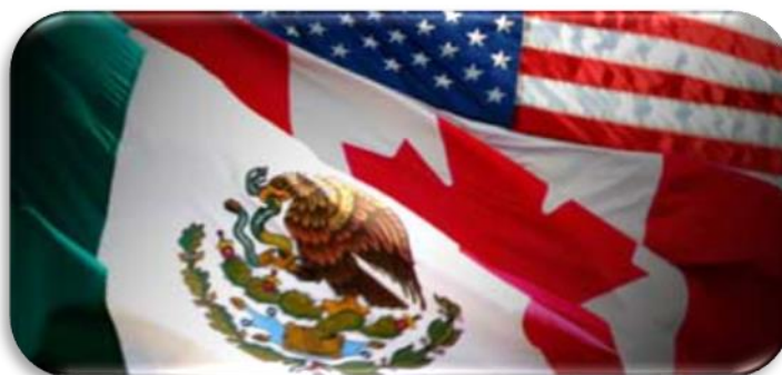
Figura 2, Tratado de Libre Comercio de América del Norte (TLCAN, NAFTA) ( http://codicesoaxaca.mx/?p=16524 ) consultado el 23 de abril del 2014.

En algunas ocasiones nos hemos puesto a pensar en la situación de las relaciones en América, imaginando como sería si se tuviese una relación fuerte en referencia a lo político, lo social y lo económico, conociendo que existen enormes diferencias entre los países de estos tres términos. Aun así existen ciertas relaciones de grupos regionales en el continente Americano y están agrupados en diferentes grados de integración económica, por ejemplo el Tratado de Libre Comercio de América del Norte, al cual pertenecen Canadá, Estados Unidos de América y México; el Mercado Común del Sur (MERCOSUR) donde sus miembros son Argentina, Brasil, Paraguay, Uruguay y Venezuela; entre otros.