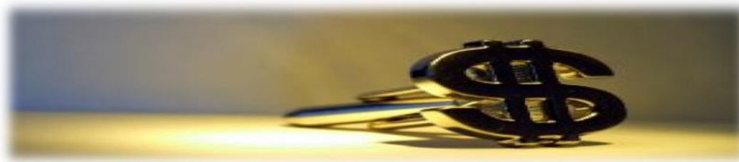
Figura 8, signo del dólar, ( http://www.freepik.es/foto-gratis/simbolo-del-dolar_348416.htm ), consultado el 24 de abril de 2014.

La economía en América es muy notoria y muy marcada, Ya que la diversidad en lo que se refiere a las políticas económicas existentes, siendo una región diversa en lo referente a lo político y económico y así mismo inestable por las grandes cambios de enfoques en lo que se refiere a las políticas económicas en los países de la región lo cual genera constantes conflictos internos como externos en la historia latinoamericana.