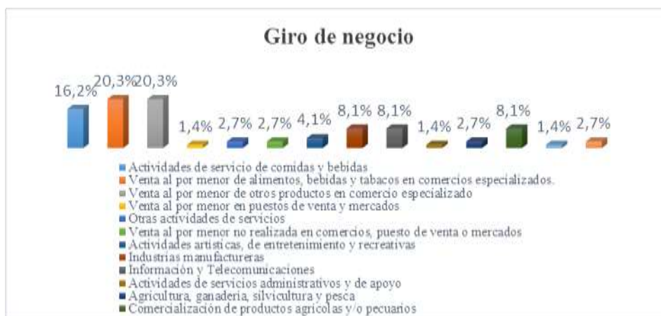
Gráfico 3: Giro de negocio de emprendimientos Fuente: Investigación de campo Elaborado: Autores

De estos 131 emprendedores, el 83.8% tenían conocimiento del negocio; el 59.5% son líderes propietarios de los mismos; el 44.6% mantienen su negocio entre 1 y 5 años, es decir la mayoría (55.4%) de emprendimientos han superado el riesgo al fracaso (gráfica 02); consecuencia del compromiso con el bienestar de su familia (86.5%), sacrificio y entrega total al negocio (98.7%), capacidad para comunicar y vender (86.5%), y de la creatividad (83.8%).