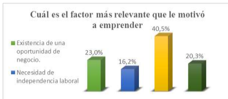
Gráfico 4: Factor relevante para emprender Elaborado: Autores

Debemos señalar que los emprendimientos otorgan al propietario un mayor estatus que aquel que no emprende debido a que es identificado como una persona de valía y empuje; asimismo le proporciona un mayor conocimiento técnico y social generado por la experiencia y el contacto diario con personal. La experiencia determina que para el emprendedor es fundamental trabajar con créditos (45,9%), por otro lado, el 24,3% de investigados no trabaja con créditos considerando que poseen su capital propio y existe cierto grado de desconfianza con la situación socio -política del país que no permite planificar a largo plazo