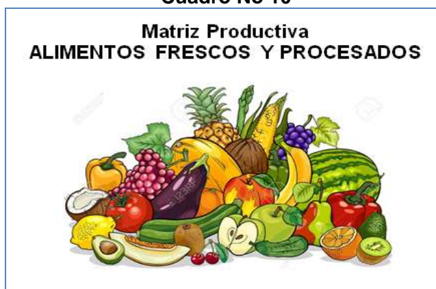
Cuadro No 10