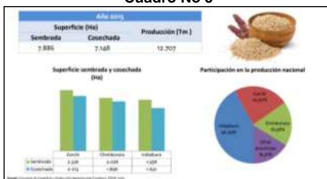
Cuadro No 5

Es necesario además conocer los cultivos de mayor producción; así como de la explotación ganadera.