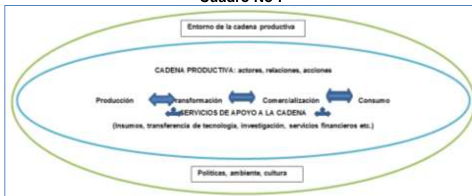
Cuadro No 7

Contrariamente a lo que se piensa a veces, las cadenas no son estructuras que se construyen desde el Estado; existen desde hace mucho tiempo y siempre existieron. El análisis de cadenas es solo una herramienta de análisis que permite identificar los principales puntos críticos que frenan la competitividad de un producto, para luego definir e impulsar estrategias concertadas entre los principales actores involucrados.