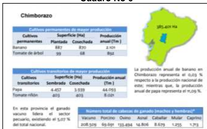
Cuadro No 6

Es necesario además conocer los cultivos de mayor producción; así como de la explotación ganadera.