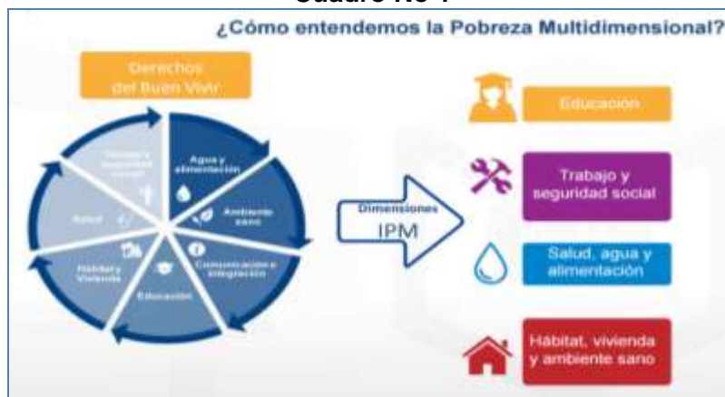
Cuadro No 1

En forma general para que la familia campesina pueda integrarse al régimen del buen vivir; deberá satisfacer sus necesidades básicas en alimentación, salud, educación, vivienda y vestimenta, lo cual el 35% de los ecuatorianos se encuentra en condiciones de pobreza multidimensional según datos del INEC 2015.