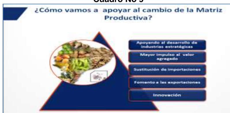
Cuadro No 9