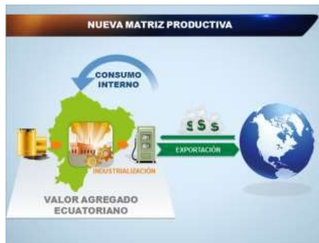
Figura 2.- Nueva Matriz Productiva