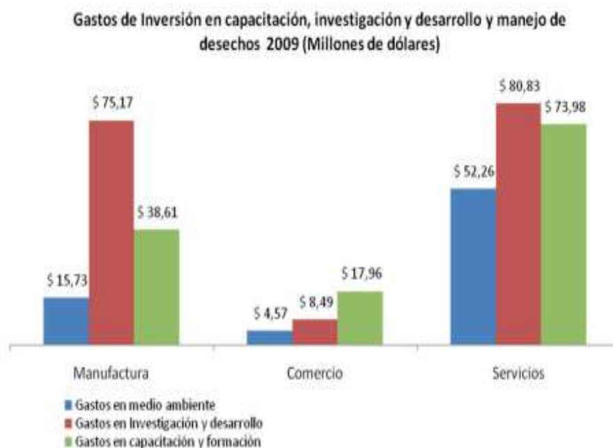
Figura 1.- Gastos de inversión efectuado por las PYMES ecuatorianas