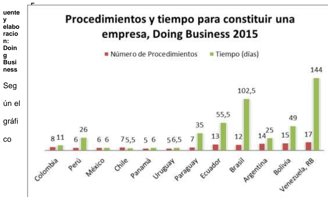
Gráfico # 1: Tiempo y número de trámites para Hacer Negocios en el Ecuador y principales economías latinas.

De acuerdo a las estadísticas mostradas dentro del PNBV, las cuales fueron tomadas de la página de Doing Business (Haciendo Negocios) del Banco Mundial, se nos presenta, la cantidad de días y número de procedimientos necesarios en el país para poder realizar la apertura legal de un negocio y su comparación con las principales economías latinas: