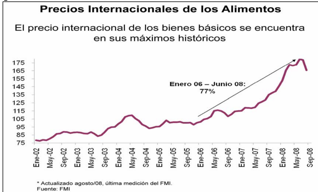
Figura1: Precios Internacionales de los alimentos

Los países latinoamericanos con fuerte tendencia exportadora basada en los commodities se verán golpeados en su balanza comercial. Los commodities agrícolas que por su naturaleza están menos expuestos a los ciclos económicos, tendrán un mejor comportamiento que los energéticos; previéndose en el mercado una estructura de contacto en los precios forward, situación que se debe a una posible escasez futura de alimentos debido a factores climáticos y a la posible recuperación de la demanda para finales de 2009, si las medidas económicas adoptadas por los gobiernos, tienen una repercusión positiva sobre la economía global. (Lafayette, 2008; Gil, 2009)