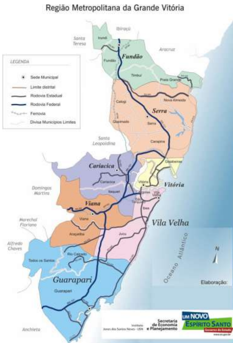
Figura 1 – Região Metropolitana da Grande Vitória